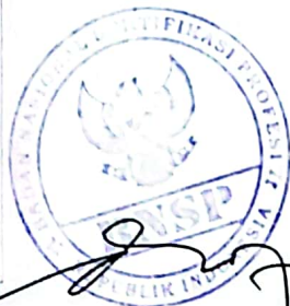
Budi Santoso Tanda tangan pemilik Signature of holder