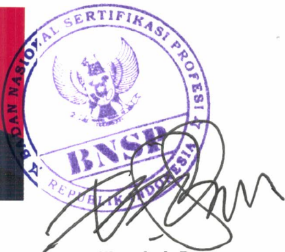
Emilianshah Banowo Tanda tangan pemilik Signature of holder